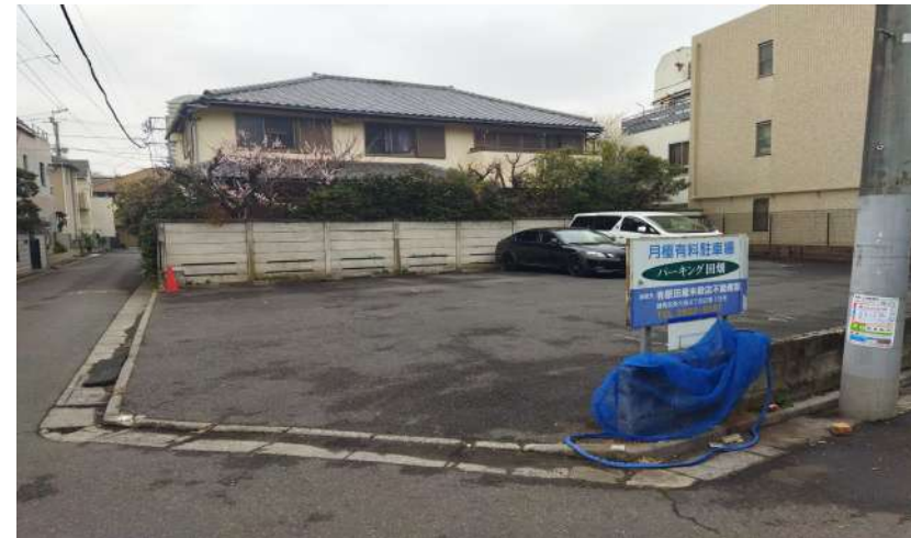
【パーキング田畑 (5番・6番 小野寺内科クリニック専用駐車場)】